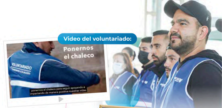
Vídeo del voluntariado:

Durante el primer trimestre del año, la Fundación Familia Bocar A.C., diseñó y ejecutó la campaña interna de comunicación " Ponte el Chaleco ", con el propósito fundamental de establecer un sólido canal de comunicación con las voluntarias y voluntarios del Grupo Bocar . Esta estrategia se estructuró en torno a tres elementos clave, con el fin de maximizar su efectividad y alcance: