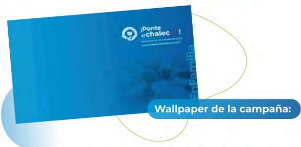
Wallpaper de la campaña:

La planificación de la campaña se llevó a cabo de manera meticulosa durante el primer trimestre del año , considerando cuidadosamente cada detalle para garantizar su efectividad y coherencia con los objetivos establecidos . Posteriormente, la implementación se inició en el segundo trimestre, desplegando los recursos y actividades planificadas para involucrar y motivar a la comunidad del Grupo Bocar hacia el voluntariado.