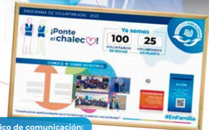
Tablero físico de comunicación: